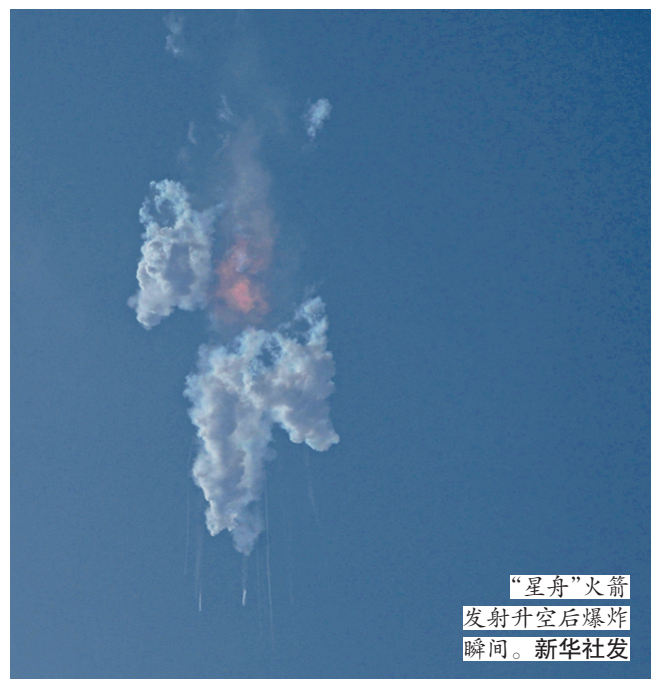
“星舟”火箭 发射升空后爆炸 瞬间。