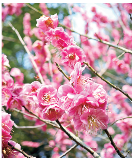
宝塔山“梅”艳动人