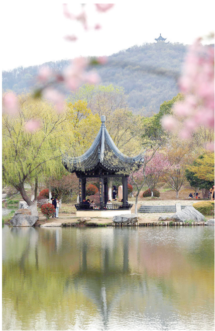
南山春早