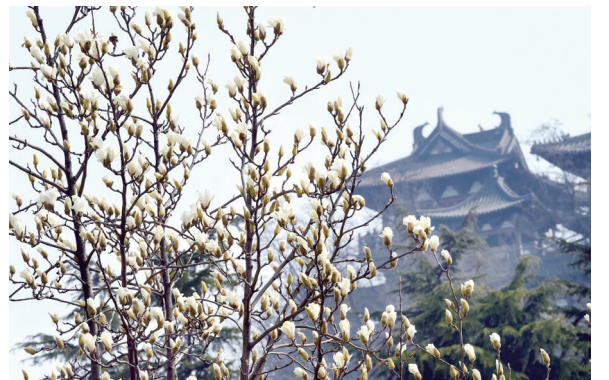
花漫北固 王呈 摄