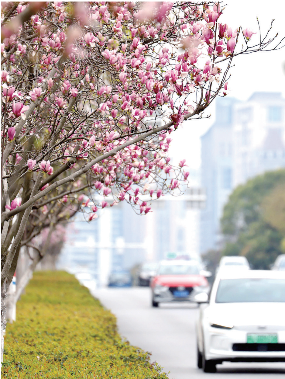
南徐路边宝华玉兰迎春绽放

又是一年春光好。三月的镇江，春暖花开，又到赏花的好时节。玉兰、梅花、桃花、海棠、樱花、紫荆……迎风摇曳，带来阵阵芬芳。粉的、红的、白的，姹紫嫣红、争奇斗艳，一派春天的美好景象。