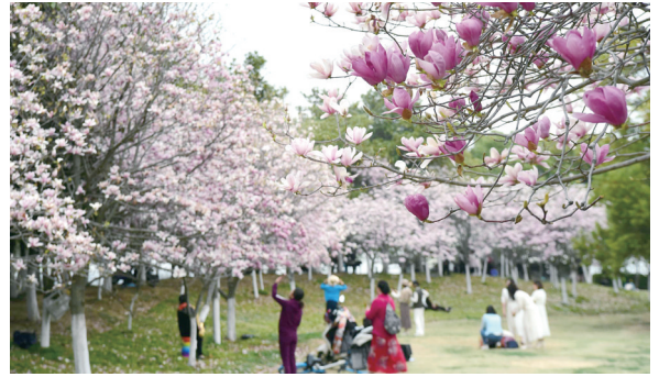
春色醉游人