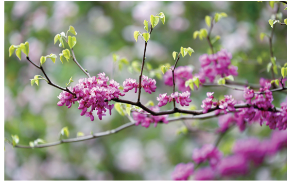
紫荆花开迎春到