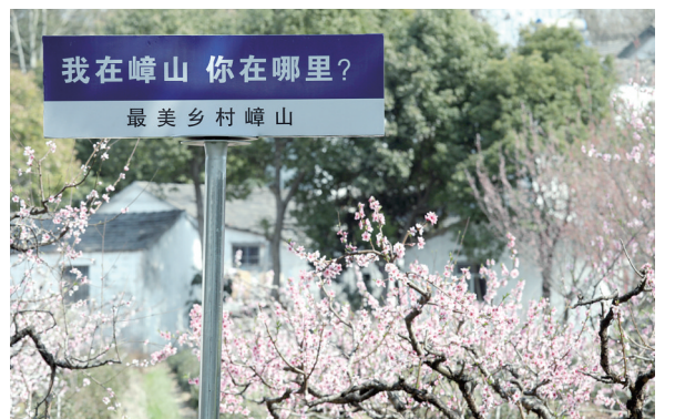
嶂山桃花开