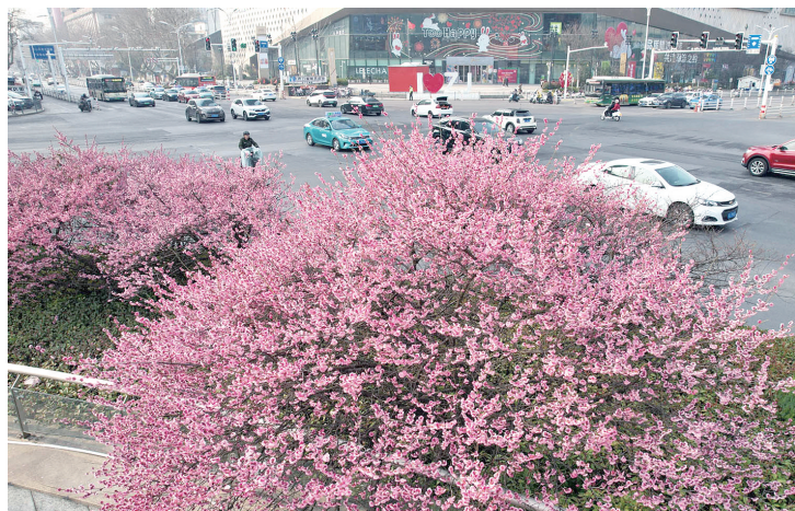
春到大市口