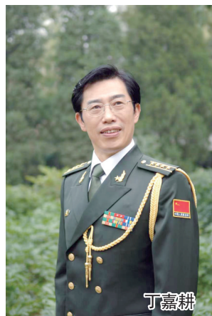
本报记者 周本林 本报通讯员 张泽宇

一段时间以来，曾在镇江工作的著名书法家丁嘉耕真可谓喜事连连：3月16日，人民日报《人民眼光》转载他的散文《霜雪催开的奇葩》；在我国现行宪法公布施行40周年之际，由法治日报社编、法律出版社出版，汇集书法名家书写的宪法全部法条书法作品集《书·法中华人民共和国宪法》付梓上新，丁嘉耕书《宪法》第118条；丁嘉耕再次亮相央视，在由著名主持人沙桐现场直播的体育赛事中，现场挥毫并为公益活动募捐。