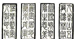
山水荣炳 2.0x2.0 cm

卧龙水库旁卧龙村,村子不大,只有西谷里、卧龙桥、湖达里、凌甲庄和沈家棚5个小自然村,共300多户人家,不足千人,我曾任在小村兼任了2年村委会主任。水库下有卧龙湖,河上有座卧龙桥。查《丹徒县地名录》,原来是乾隆皇帝下江南,曾在桥下过夜,因而取名“卧龙桥”。有年发大水,桥冲垮了;后来又建了一座木桥,在上世纪70年代就坏了;近几年,农村路桥改造,才成了现在这座由大石块砌成的石桥。