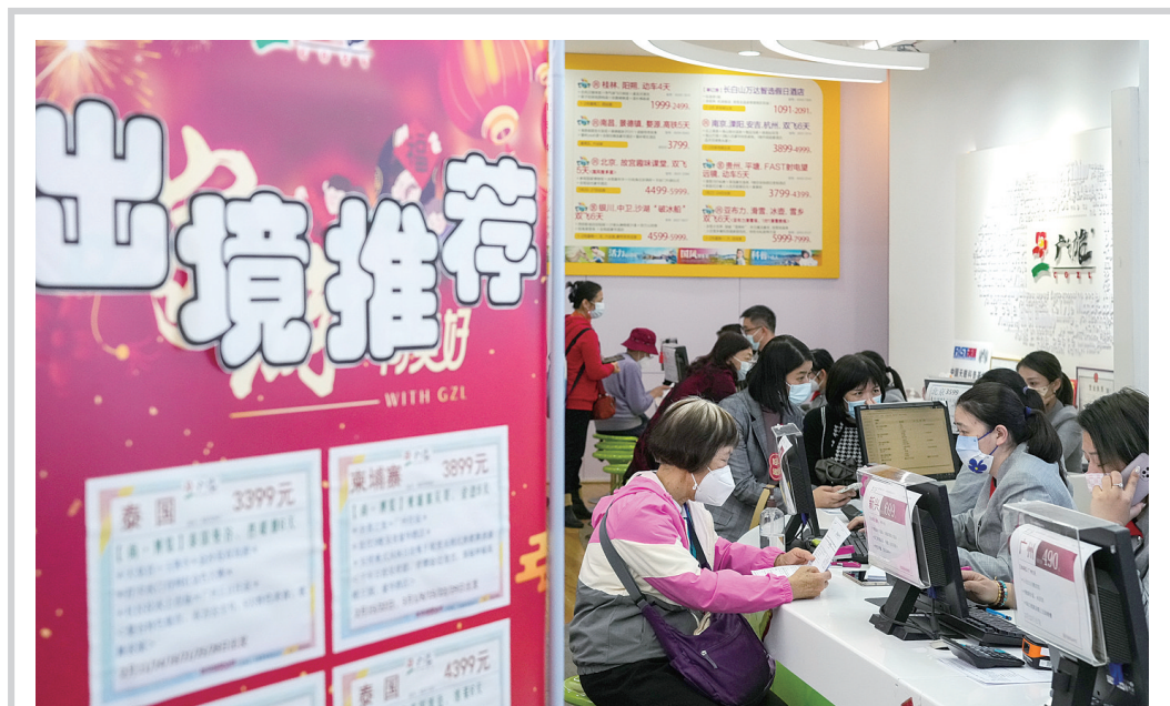
广州:出境团队旅游业务复苏