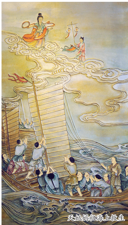
天妃妈祖海上救生

取各种措施营造一种文化环境的生态平衡，让传统文化与现代文化相存相融。要把保护民间文化资源转化为一种现实动力，一方面可以通过宣传、普及教育，促进人们对文化多样性的认识，提高人们对于保护传统民间文化的社会意识；另一方面大胆尝试和创新，推进传统文化融入当代生活，通过旅游开发、举办各种展览、资源共享来与现实生活结合。这方面，镇江市西津渡历史文化街区作了有益的探索。