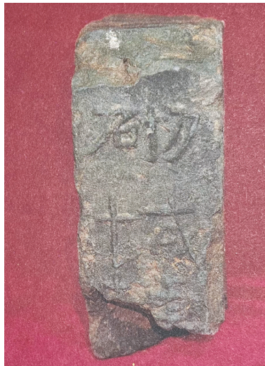
出土唐代“砌城”文字砖