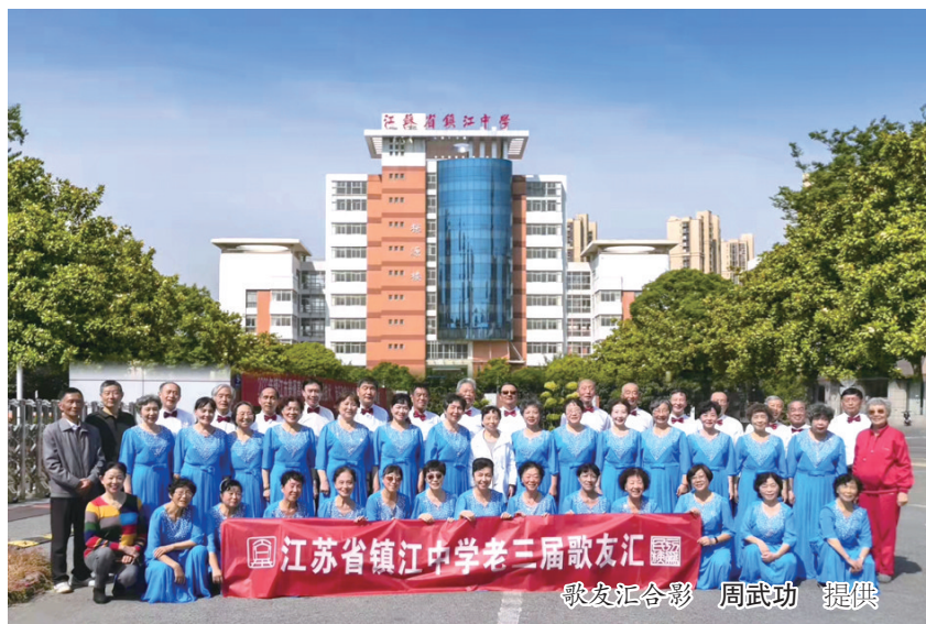
歌友汇合影

今年10月16日早晨八时整，秋阳普照，微风轻拂。“省镇中老三届歌友汇”近五十位歌友按时在江苏省镇江中学校门口集中，通过了一道安检，终于跨进了梦中的母校。