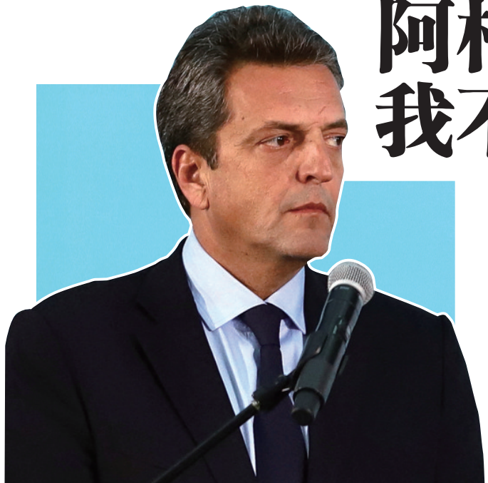
8月3日,在阿根廷首都布宜诺斯艾利斯,刚上任的经济部长塞尔吉奥·马萨参加就职仪式。

阿根廷刚上任的经济部长塞尔吉奥·马萨发布了一系列旨在挽救国家财政免于破产的政策措施,包括承诺完成降低赤字目标、履行外债偿付义务。