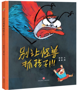
《别让怪兽抓孩子》 谢茹 著 蘑菇 绘 天地出版社 定价：39.80元

直击生活中常见却不起眼的安全隐患，帮助家长和孩子学会分辨潜在危险，树立安全意识。满满的想象力+超强的教育意义。拒绝说教，故事新颖，画面活泼，潜移默化中边笑边学。