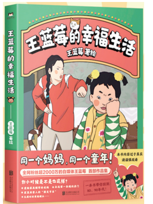
《王蓝莓的幸福生活》 王蓝莓 著 北京联合出版公司 定价：34.50元

直击生活中常见却不起眼的安全隐患，帮助家长和孩子学会分辨潜在危险，树立安全意识。满满的想象力+超强的教育意义。拒绝说教，故事新颖，画面活泼，潜移默化中边笑边学。