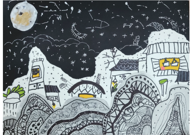
《梦里水乡》江思瑞 中四班 指导教师 薛辰慧