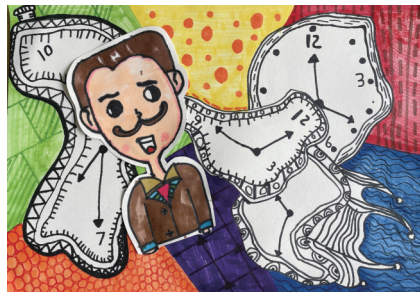
《达利的时针》曾梓言 中二班 指导教师 乔晶晶