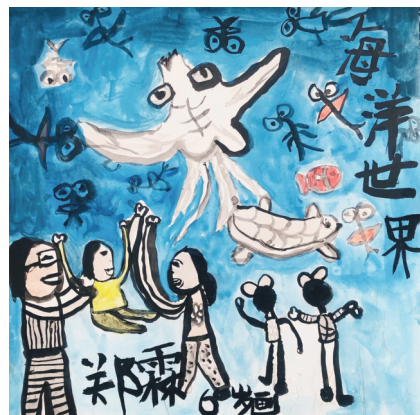
《海洋世界》郑霖 大二班 指导教师 祝敏