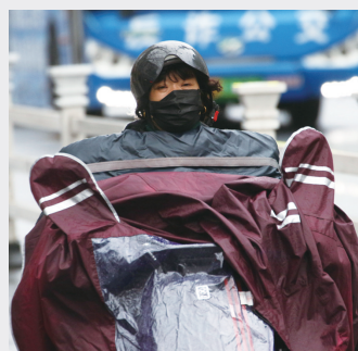
昨日，受冷空气影响，强风降雨袭我市，气温下降明显，给出门的市民带来不便。