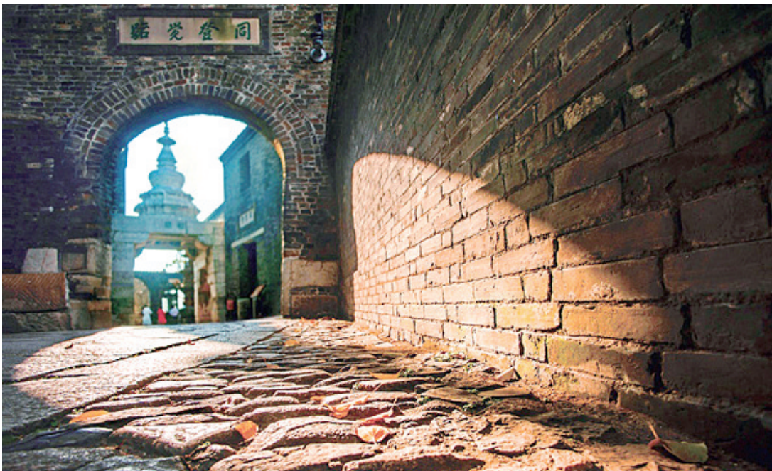
《古街之秋》