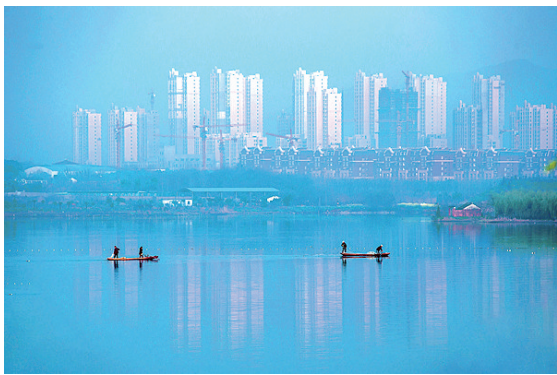
《晨起谷阳湖》