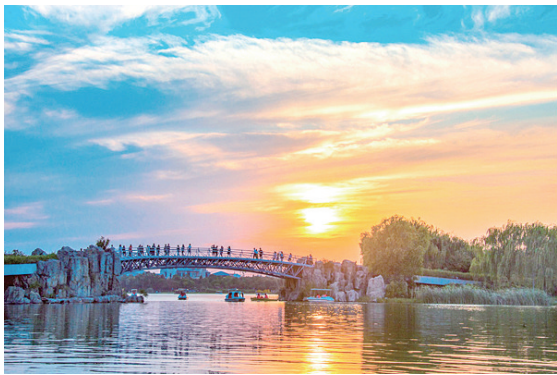
《夕照金山湖》