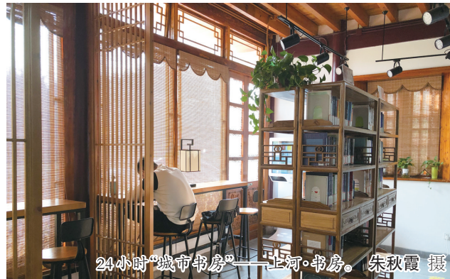
24小时“城市书房”——上河·书房。

提到阅读，一般想到的都是传统的图书馆或者书店，实际上，在“书香镇江”，像“马副官的店”这样的主题“阅读新空间”现在已有40多个，书香，悄悄在城市的街头巷尾氤氲。